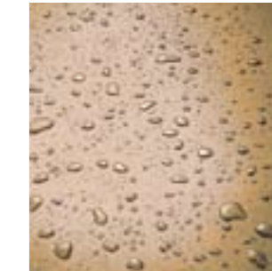
Каменная пропитка с водоотталкивающим эффектом.