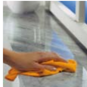
Силиконовый полироль чистит и обновляет блеск.

Для удаления масляных и жирных пятен с каменной поверхности кухонных рабочих мест применяется АКЕМИ Кремобразная паста [7] . Рекомендуем удалять пятна незамедлительно.