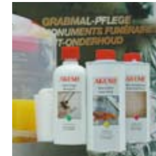
Средства по уходу за монументами из натурального и искусственного камня.