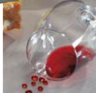
Защитные пропитки безвредные, защищают от образования пятен.