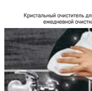
Кристальный очиститель для ежедневной очистки.