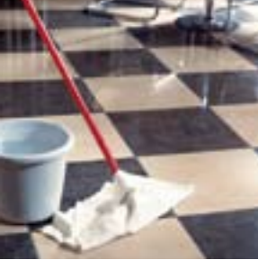
Мыло для камня для регулярной очистки поверхности