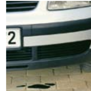
Кремобразная паста удаляет пятна масла и жира.

Загрязненные различными атмосферными осадками каменные поверхности террас время от времени должны очищаться с помощью АКЕМИ Очистителя камня [1] . Случайно пролитый жир от тушки цыпленка, легко удаляется АКЕМИ Кремобразной пастой [7] . Рекомендуем удалять пятна незамедлительно. Незащищенные окружающие каменные стены и мостовые в саду постоянно подвергаются загрязнению и обесцвечиванию натуральными отложениями, такими как птичий помет, листва, плесень и т.п., что неминуемо приводит к обесцвечиванию камня. Для удаления таких загрязнений на помощь придет АКЕМИ Очиститель плесени POWER [6] .