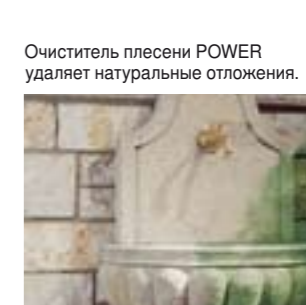
Очиститель плесени POWER удаляет натуральные отложения.

Выцветшую и запачканную различными отложениями поверхность следует очищать АКЕМИ Очистителем плесени POWER [6] . Препарат позволит легко очистить следы плесени и вернуть поверхности камня оригинальный цвет. Последующая за очисткой обработка АКЕМИ Силиконовым полиролем [17] , позволит законсервировать оригинальный цвет поверхности, придав былой блеск.